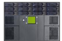
Active Media Library 4X